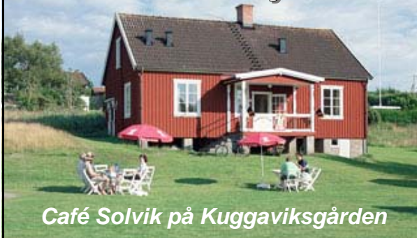
Café Solvik på Kuggaviksgården

Under sommarmånaderna bedriver Kuggaviksgården café i kökshuset på Solvikskolonin. Cafét sköts ideellt av Kuggaviks Vänner. Cafét håller öppet på eftermiddagarna och "jobbet" består i att servera kaffe, the, våfflor, smörgåsar, glass m m.