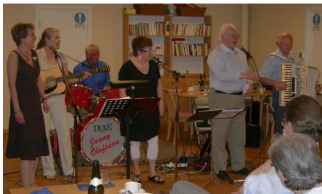
Distriktsårsmötet avslutades med supé och uppskattad underhållning med Tvååkers revyamatörer.

Jubileet är värt att uppmärksamma, tycker distriktsstyrelsen, och har därför tagit in en studietsatsning kring nykterhetsrörelsens halländska historia i arbetsplanen. Förhoppningen är att det ska bli många studiecirkel och mycket forskning och dokumentation. Och om allt går väl kan en historik i någon form presenteras lagom till nästa distriktsårsmöte. Det mötet kommer att genomföras den 12 april 2008 i Varberg, där den då 125-årsjubilerande IOGT-NTO-föreningen Leon Gambetta har sin hemvist. Räkna med mycket firande.