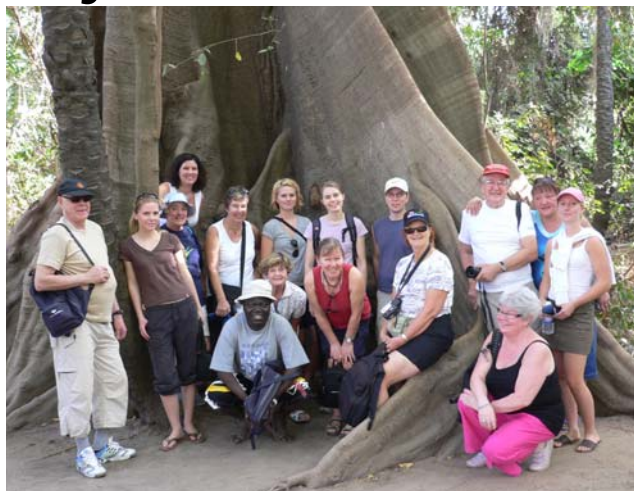
NBV:s afrikaresenärer samlade för gruppfotoografering.