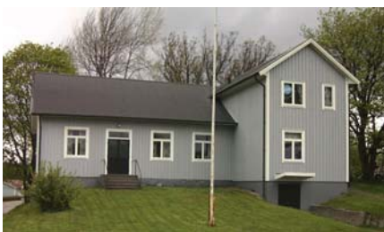
NTO-lokalen i Landeryd som den ser ut idag.