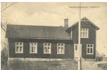
NTO-lokalen i Landeryd på ett vykort från 1915.

Förutom till IOGT-NTO:s egna aktiviteter används lokalen av föreningslivet i Landeryd.