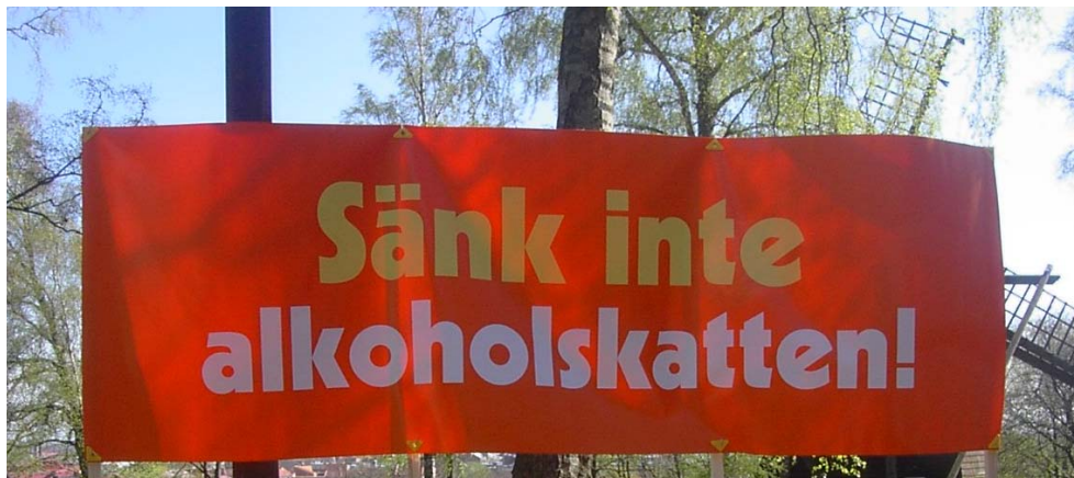
Budskapet var tydligt vid Folknykterhetens dag-firandet vid Hallandsgården på Galgberget i Halmstad.

Konsekvenserna av en sänkning blir stora. Om-