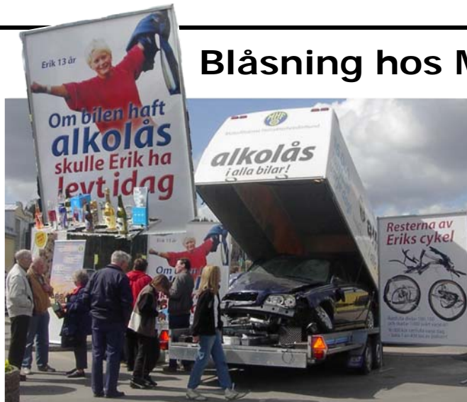
MHF hade parkerat sin alkoholbil utanför det stora varuhuset i Ullared.