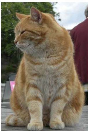
Clinton, TV-katt.

Arbetshelg 20 - 21 oktober Ring 0340 - 65 12 85 Kuggaviksgården