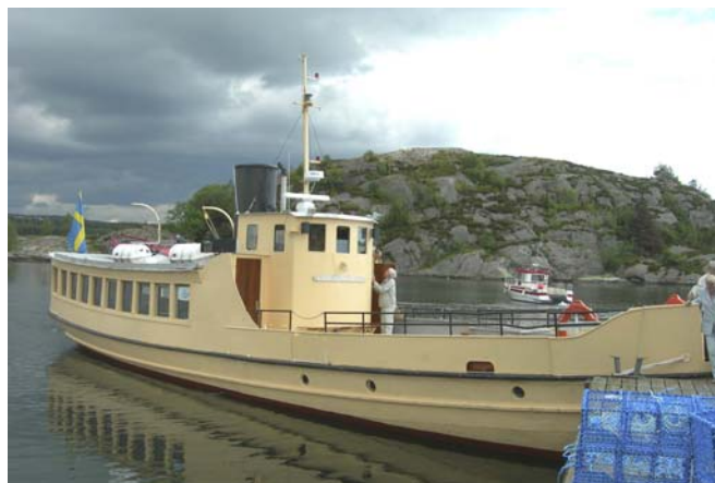
M/s Stångehufvud transporterade IOGT-NTO:are i Bohuslän's skärgård.

Åter i bussen gick färden sedan vidare över öarna Orust och Tjörn till Jordhammars Herrgård utanför Stenungsund, där det efterlängttade kaffet med fralla serverades, innan kosan styrdes hemåt till Falkenberg igen.