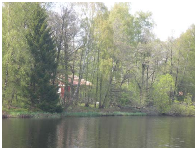
Inbäddad i lummig grönska, på en ö i Nissan mellan Folkparken och Örjans Vall, ligger Laxöns dansbana som nu åter blivit ett nyktert nöjestempel.