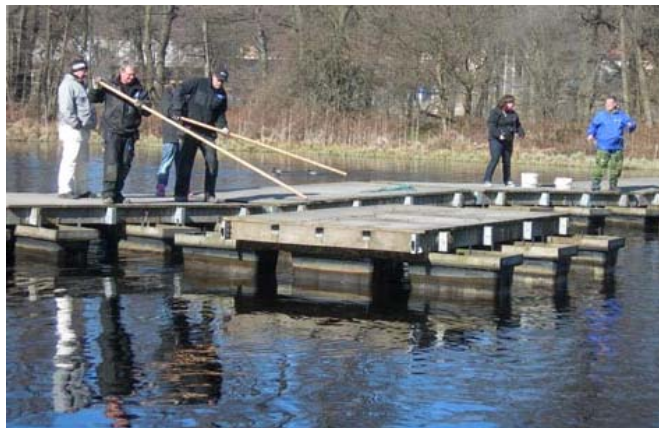
En lastbil med lyftkran, några störar och lite rep. Det är allt som krävs för att få pontonbron till Laxön på plats. Deltagarna från IOGT-NTO-projektet Muraren kollade noga och hjälpte kommunens arbetare så att hela arbetet hanns med på en dag.