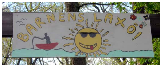
En välkomnande skylt möter när man kommer fram till Laxön.

drygt 500 gånger. Det är en skakande berättelse, som väcker många tankar, men också inger hopp om lösningar. Det är också skildringar från vardagen som de flesta nog kan känna igen sig i på något sätt. Allvar blandas med skämt och när det är dags för avslutning tror man inte att det redan gått en och en halv timme.