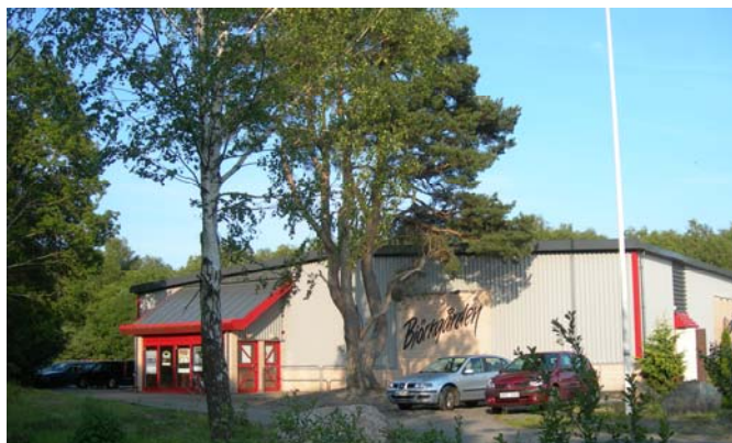
Nöjeskrogen Björkgården intill Fun City har fungerat som bingolokal för IOGT-NTO i 23 år.