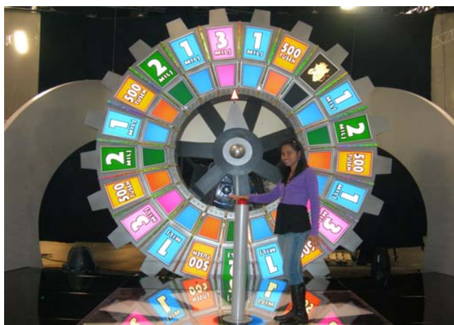
Inget snurr på det stora finalhjulet när IOGT-NTO Halland besökte BingoLotto.

Detta hade dock inte varit möjligt utan uppförande insatser av det tioalet funktionärer, som troget ställer upp som funktionärer. Det är utropare, brickförsäljare, vinstutdelare och kassörer. Som en liten bonus för väl utfört arbete under det gångna året åkte alla bingofunktionärer på söndagsutflykt till Göteborg den 16 december för att vara med som publik på den allra sista vanliga BingoLotto-sändningen i TV4. Sedan årsskiftet sänds ju lotteri-programmet i TV4 Plus.