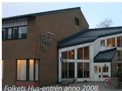
Folkets Hus-entrén anno 2008.

Hus östra fasad, men är inte längre fastighetens huvudentré.