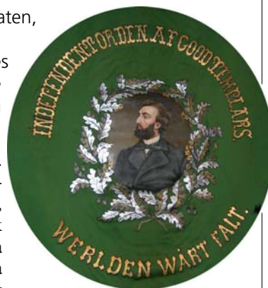
Leon Gambetta, avporträtterad på föreningens standar.

och Göteborg uppvaktade. Tillställningen, som besöktes av drygt 60 personer, avslutades med thailändsk buffé på den thailändska restaurangen (som denna speciella kväll höll öppet enkom för IOGT-NTO) tvärs över gatan.