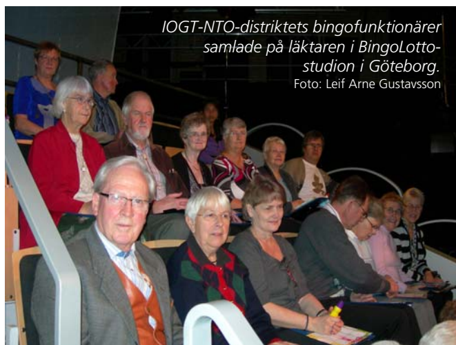
IOGT-NTO-distriktets bingofunktionärer samlade på läktaren i BingoLotto-studion i Göteborg.

Gruppen hamnade allra längst upp på läktarens ena kant, så det blev inte så många närbilder på IOGT-NTO:arna i TV-rutan. Inte heller fick de uppleva spänningen kring spelet på finalhjulet. Eftersom inga vinnare hade hört av sig utgick helt enkelt det momentet från lotteridragningen.