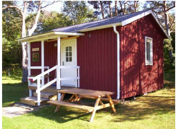
Dalstugan får snart en ny granne så att fler ska kunna njuta på Kuggaviksgården.

– Kuggaviksgården är just nu egentligen lite för liten för att kunna drivas på